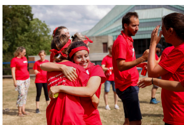
Formation et sensibilisation des jeunes