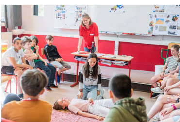
Formation et sensibilisation des jeunes