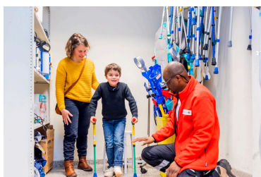
Service de location de matériel paramédical