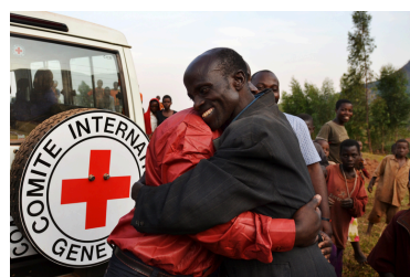
Rétablissement des liens familiaux