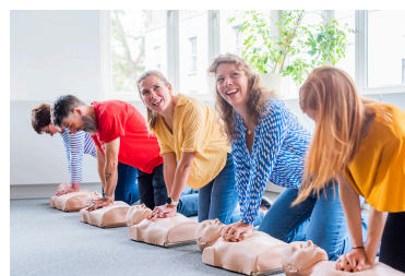
Formation aux premiers secours