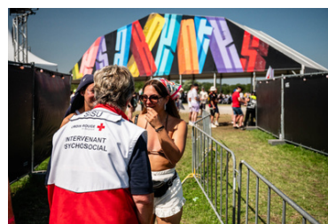
SISU Service d'intervention Psychosociale Urgente