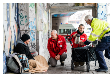
Aide aux personnes sans- abri et migrants en transit