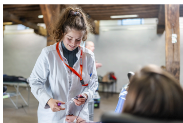
Don de sang