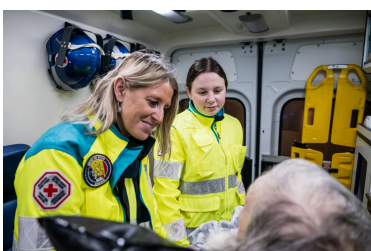
Transport urgent et non-urgent