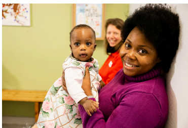
Accueil des demandeurs de protection internationale