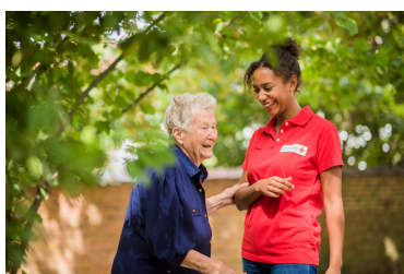
Reliage: lutte contre l'isolement social